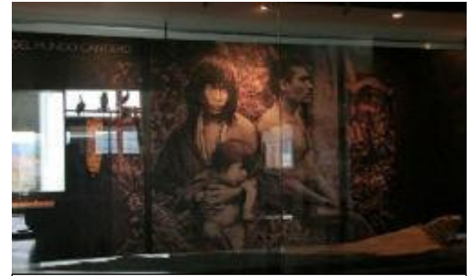
De Yagán-geschiedenis wordt verteld in het etnografisch museum Martin Gusinde te Puerto Williams op Navarino eiland, Kaap Hoorn eilanden groep.